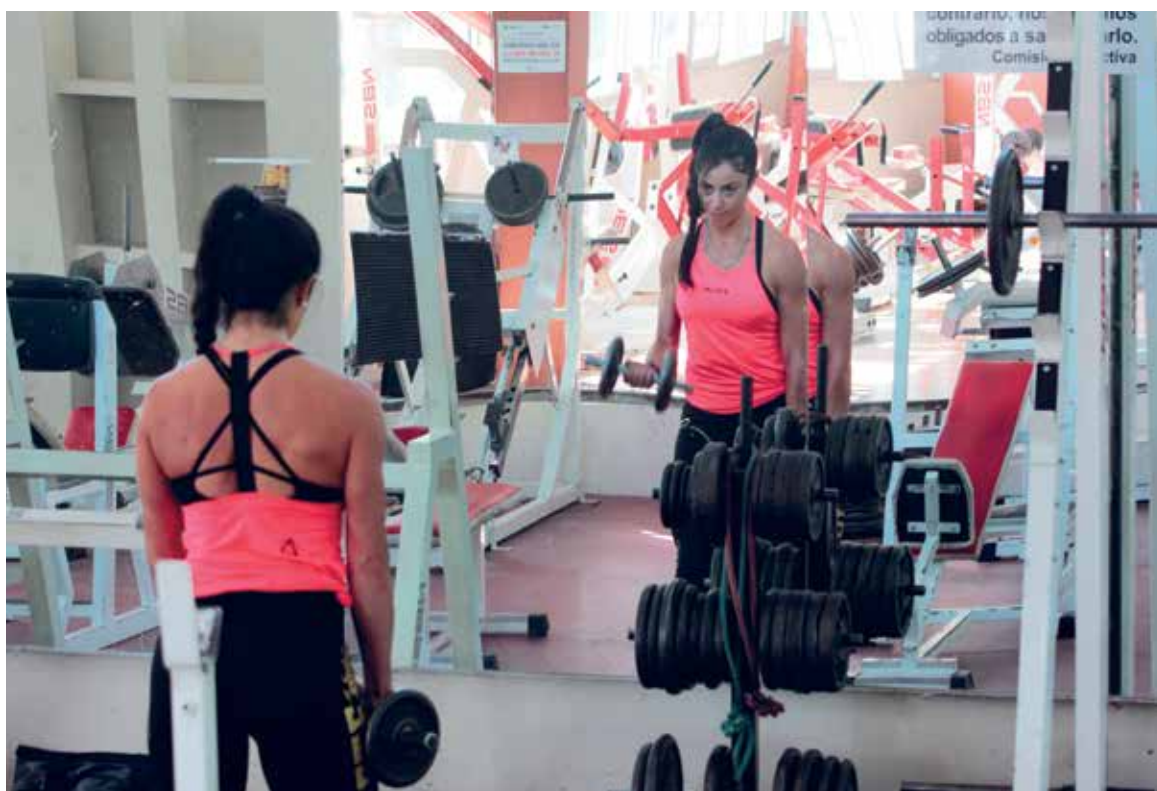
Hace más de una década que se dedica al deporte.

En las categorías que ha participado, Wellness y ahora Bikini,