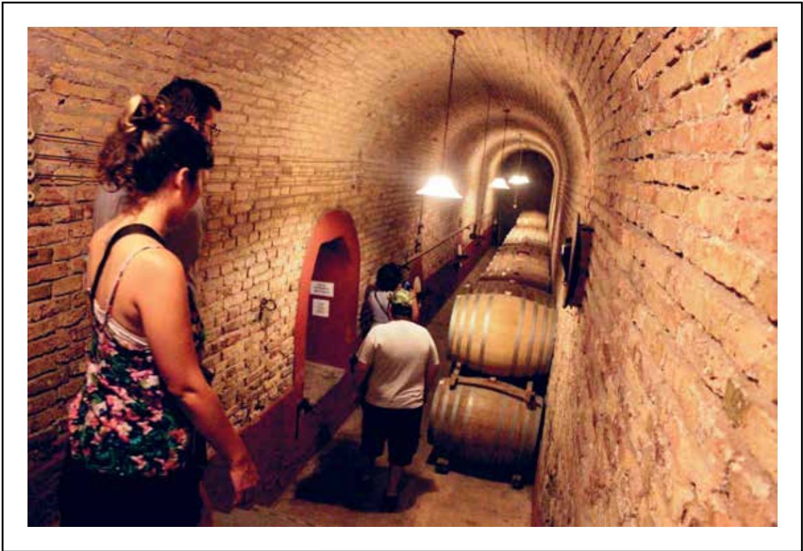
Roble y temperaturas de subsuelo para almacenar el néctar de la vid.