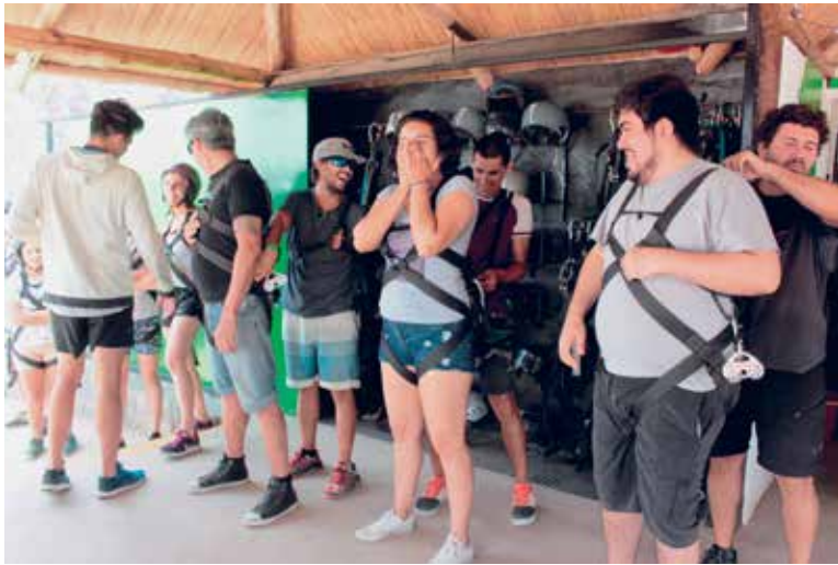
Los turistas se despiden de sus parejas antes de lanzarse por la tirolesa