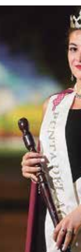
Punta del Agua - Ca