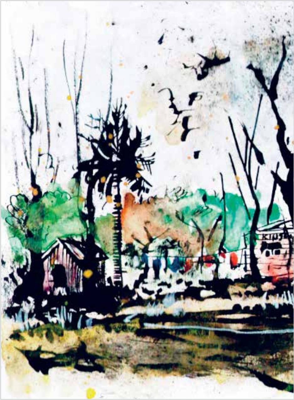
ILUSTRACIÓN MARTÍN RUSCA

Por los bulevares, gran invento militar y urbano, ¿qué ejército desfilará para dividir qué protesta desde que el tren, el teatro y el pueblo han descarrilado?