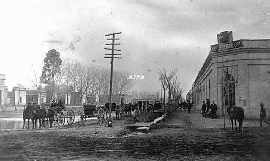
FOTO MUESTRA DEL PASADO HISTÓRICO