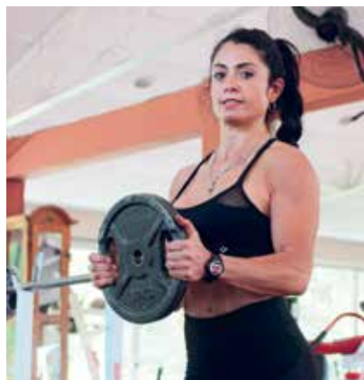
Por Facebook le piden consejos sobre rutinas de ejercicios y cómo alimentarse.

explica que es fundamental ser lo más femenina posible: el peinado, los aros, estar derechita, arregladita, que la forma de moverse sobre el escenario sea sensual, el bikini impecable, el maquillaje. “Acá en Argentina esas categorías, en las que las mujeres de cierto modo perdían la femineidad, ya no existen, primero porque usaban muchos fármacos y segundo porque la masa muscular de una mujer jamás puede llegar, naturalmente, a adquirir gran volumen. El cuerpo sufre, el corazón sufre, no es de fábrica”.