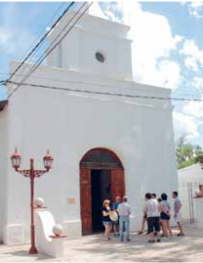
Confesaron sus pecados en la Villa