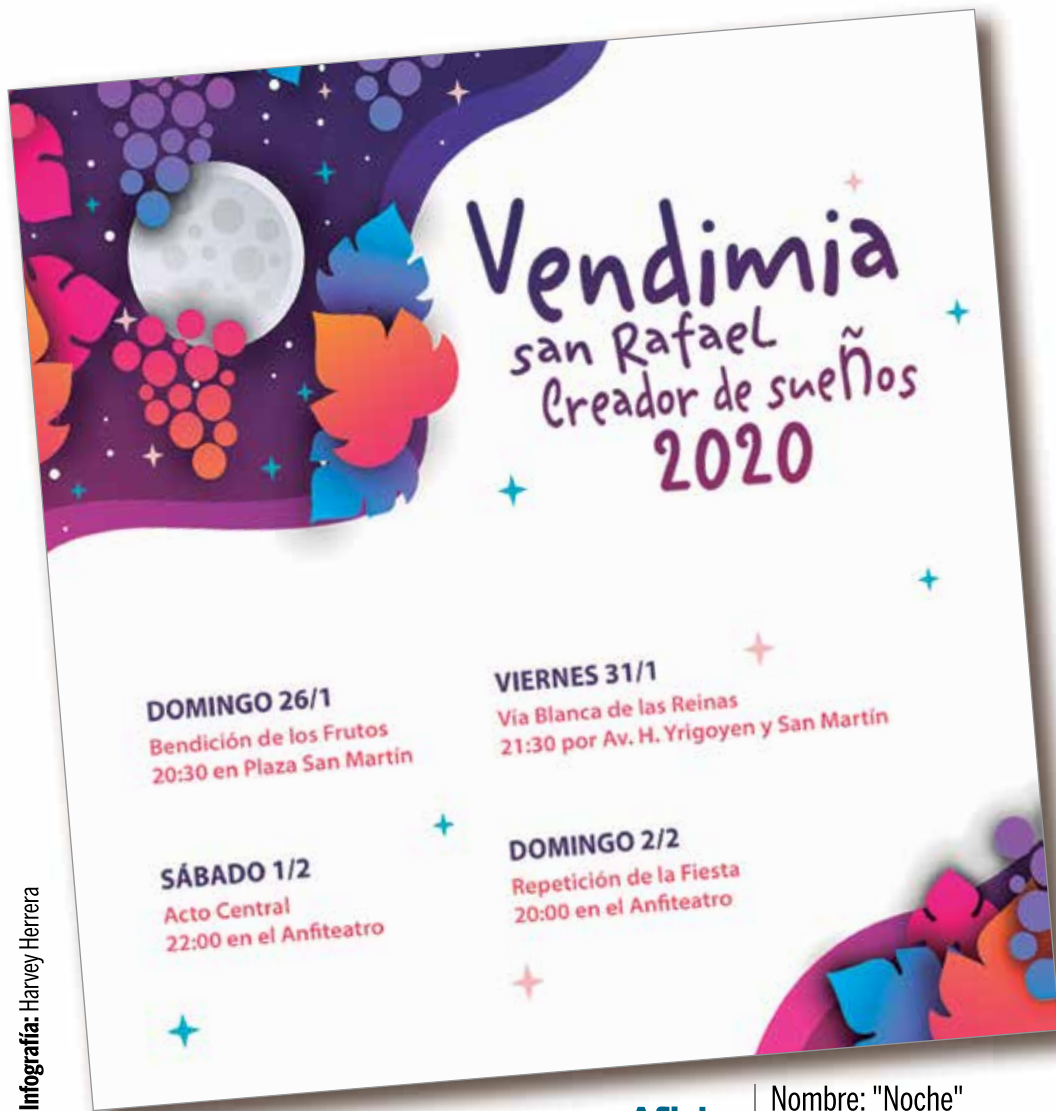
Infografía: Harvey Herrera