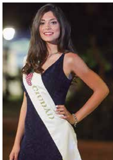
Ciudad